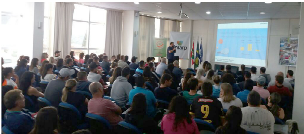
Primeiro Workshop de Capacitação e Atualização Profissional de 2018, realizado em Caçador

A série de workshops pretende passar por todo o Estado, em um novo formato, baseado nos Seminários Regionais de Formação Continuada, porém com ainda mais vivências práticas e temas regionalizados. O foco se dá nas demandas que os profissionais apresentaram nas edições anteriores, com a proposta de trazer mais valor e soluções para as