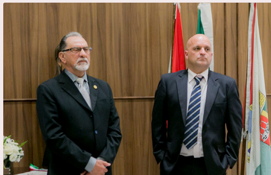
Representantes do Itamirim Clube de Campo (CREF 000352-PJ/SC)