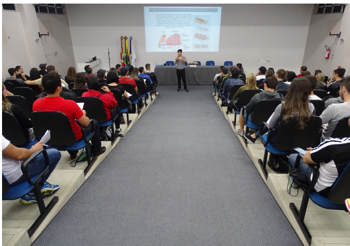
Curso de Fisiologia Aplicada à Musculação

Veja abaixo fotos de todos os cursos disponibilizados: