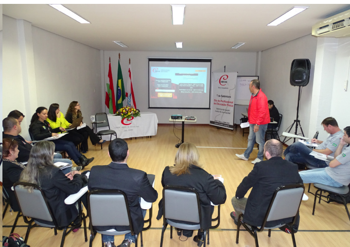
Comissões de Orientação e Fiscalização do RS, PR e SC