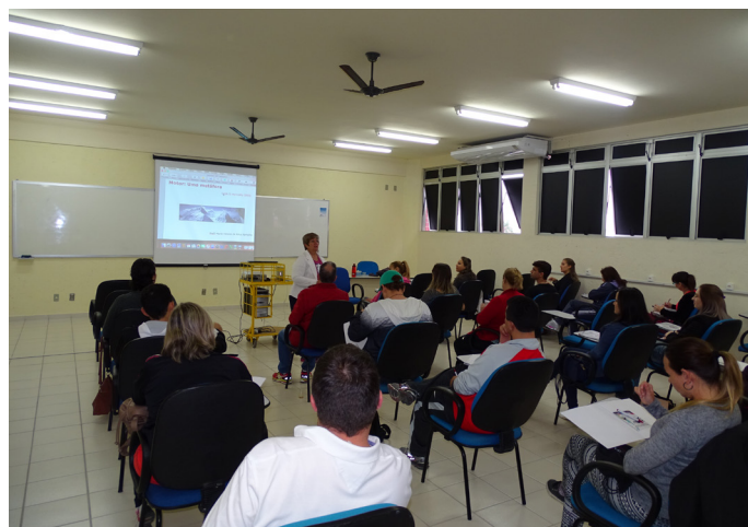
Curso de Educação Física Escolar