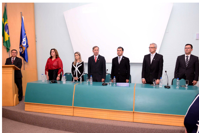
Cerimônia foi marcada pelo reconhecimento dos profissionais. Na mesa de honra, autoridades representando o Estado de SC.