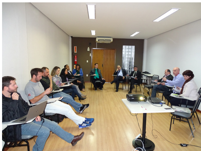
Comissões de Ética Profissional do RS, PR e SC

Alguns temas que foram tratados e discutidos no evento: fiscalização em atividades ao ar livre e nos condomínios, atuação do defensor dativo, atuação do cartorário, do simetria e aplicação de multas. O próximo encontro vai acontecer em Porto Alegre, no final do mês de novembro.