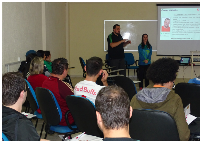
Curso de Mini Esportes e Modalidades não Convencionais