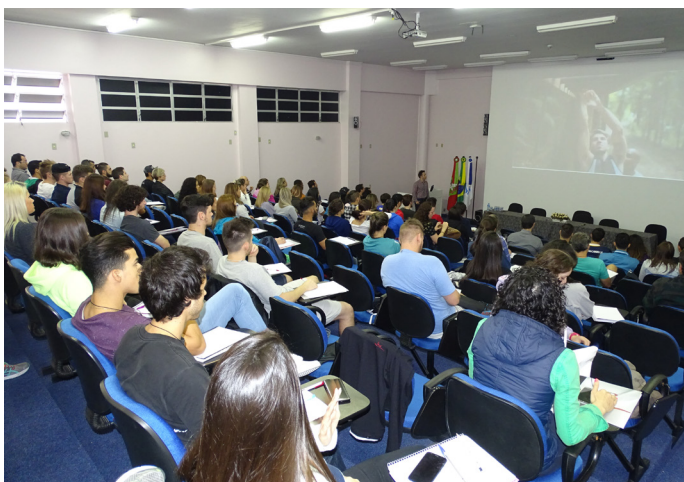
Curso de Biomecânica da Coluna Vertebral