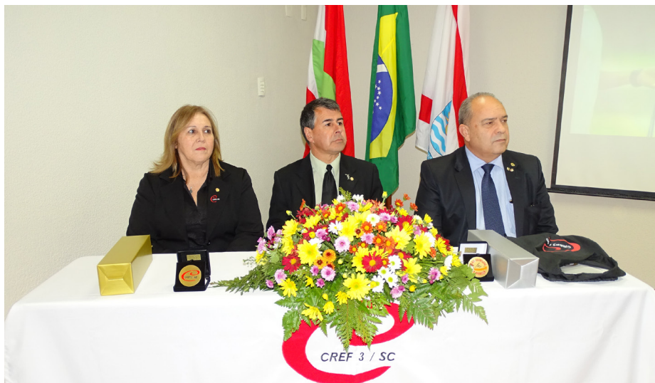
Imagens do evento que reuniu mais de 300 participantes em Blumenau