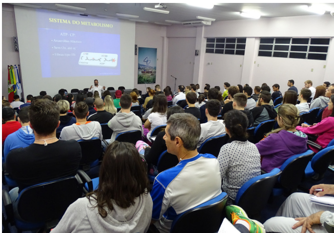
Curso Otimizando Resultado: HIIT