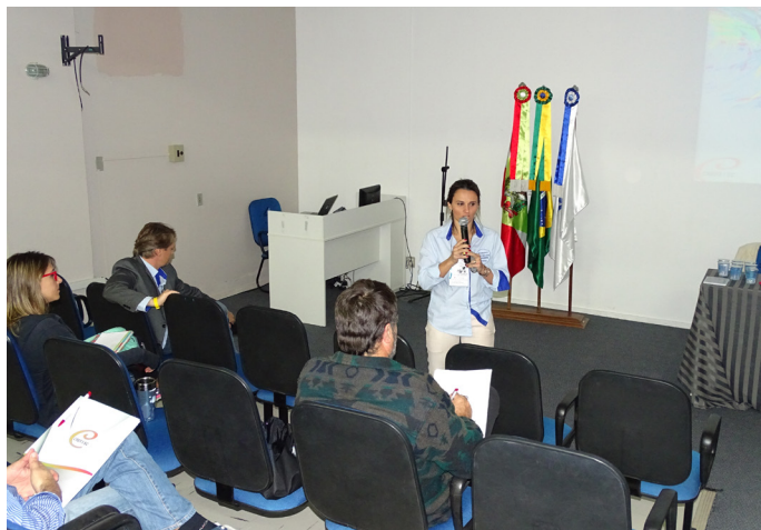
Curso de Gestão e Empreendedorismo na Educação Física