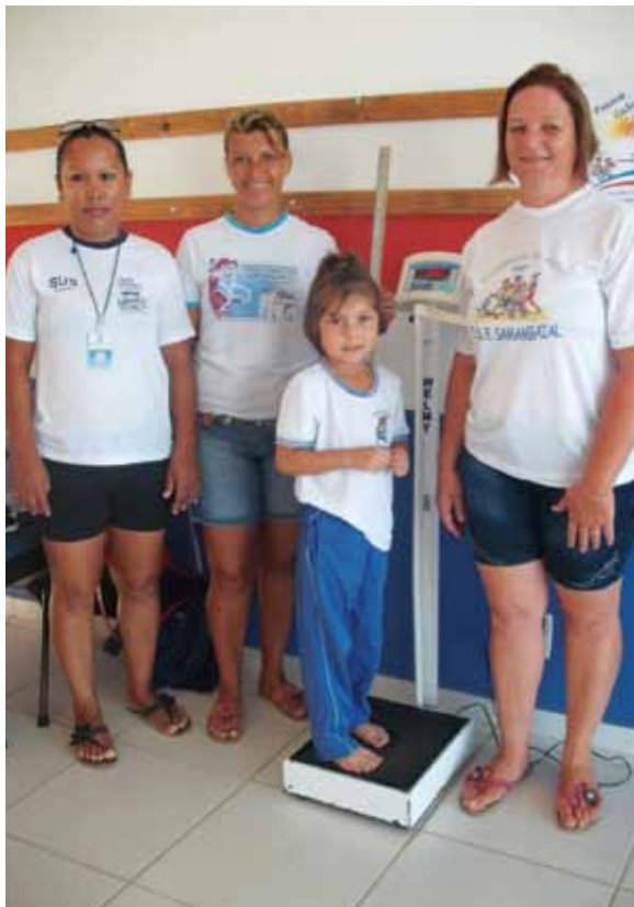
Alunos participaram de projeto de incentivo à vida saudável aliada à atividade física e boa alimentação