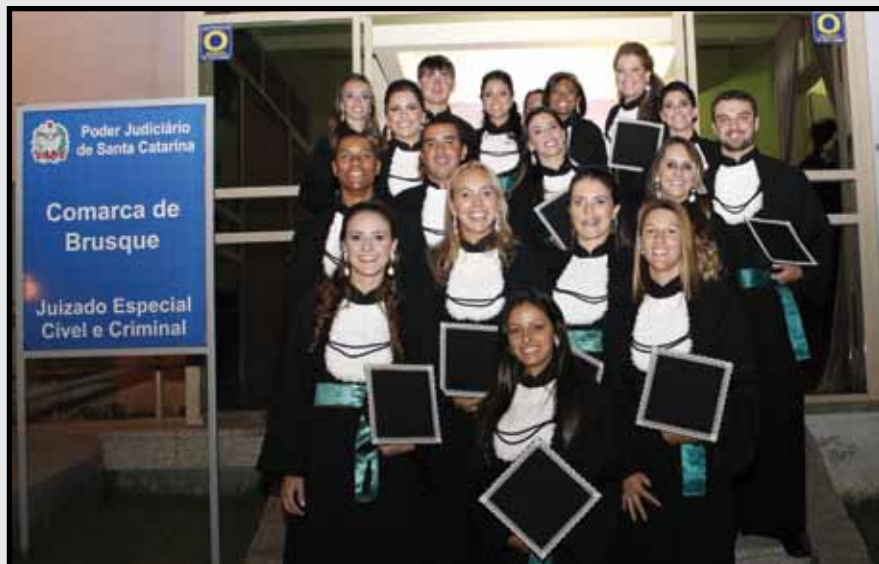
Formandos UNIFEBE Brusque - 30 de março de 2012.

Novos profissionais de Educação Física entraram no mercado de trabalho em 2012. O CREF3/SC é uma instituição que apóia o profissional de Educação Física na busca por legitimar as intervenções profissionais, valorizando a categoria. A representatividade do CREF3/SC junto à sociedade, advém de ações efetivas para disciplinar a conduta do setor de atividade física no Estado, de maneira que ela seja exercida com ética e por profissionais habilitados para o exercício formal da profissão. Parabéns aos novos graduados!