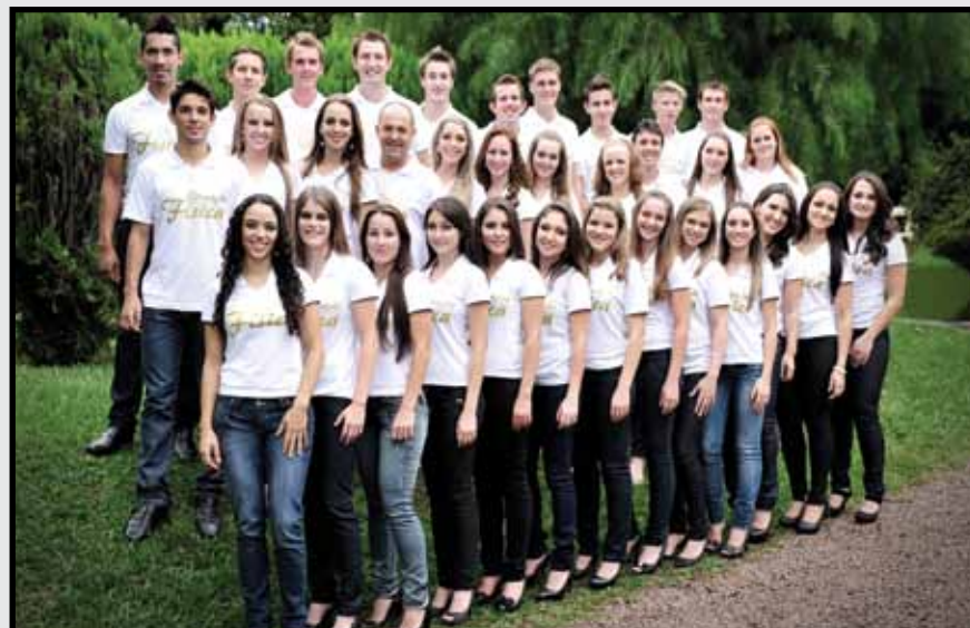
Formandos UNOESC São Miguel do Oeste - Agosto de 2012.