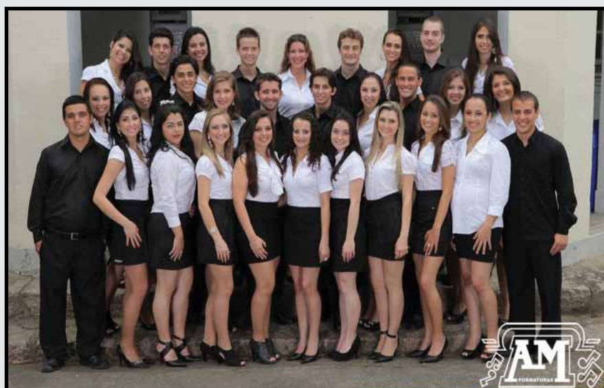
Formandos UNISUL Tubarão - 12 de maio de 2012.