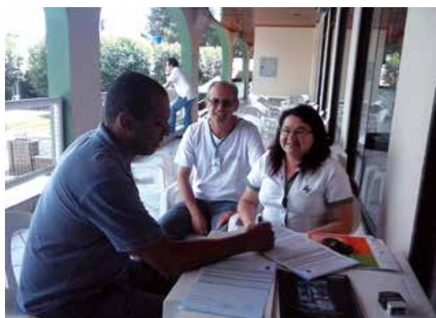
Agente de Orientação Filipi em ação conjunta com os fiscais da Vigilância Sanitária de Lages, realizada em outubro

EDITAIS PÚBLICOS – Foram verificados no período mais de 30 editais de processos e concursos públicos com vagas para profissionais de Educação Física. As prefeituras que não incluíram no edital a exigência do registro profissional receberam ofício do Conselho para promover a devida retificação.