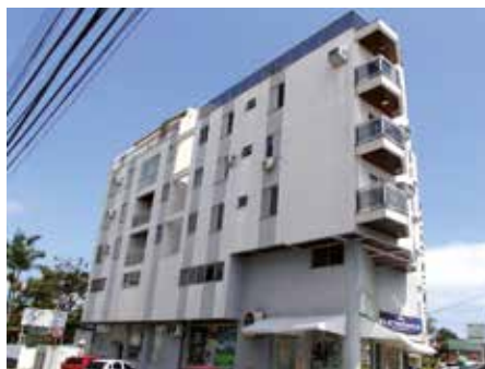
Em Coqueiros, a segunda sede ainda alugada