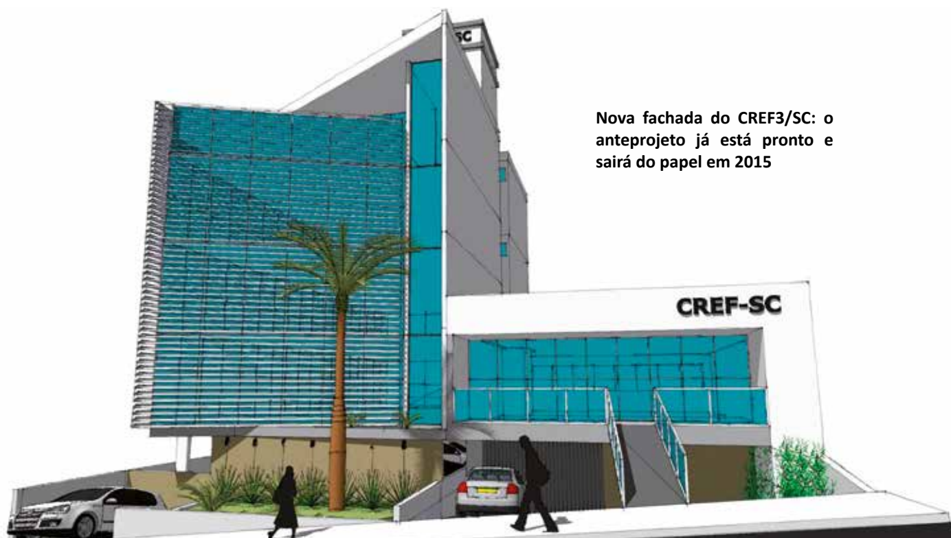
Nova fachada do CREF3/SC: o anteprojeto já está pronto e sairá do papel em 2015