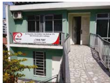
Sede própria do Conselho, inaugurada em 2003