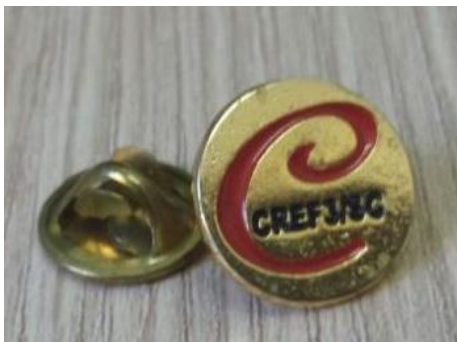
Item 24: Pin em metal banho dourado

Imagem ilustrativa, poderá sofrer alteração de acordo com solicitação do Contratante.