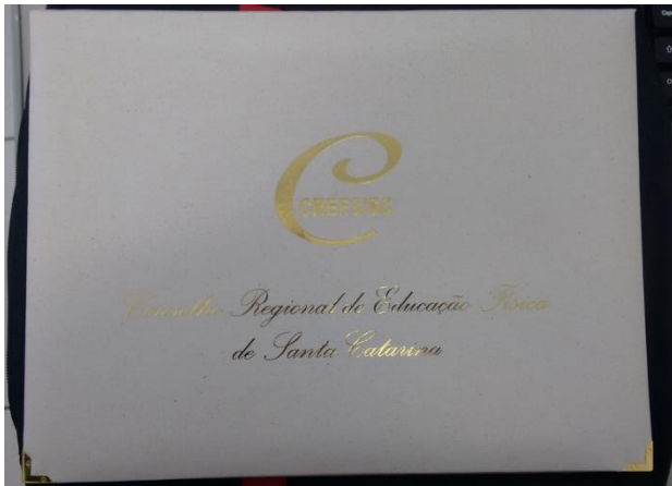
Item 23: Porta certificado