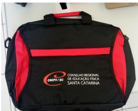
Item 35: Pasta em poliéster, com bolso frontal, com zíper.

Imagem ilustrativa, poderá sofrer alteração de acordo com solicitação do Contratante.